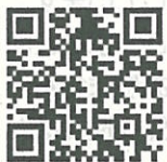
↑岡山大学 アクセスマップ